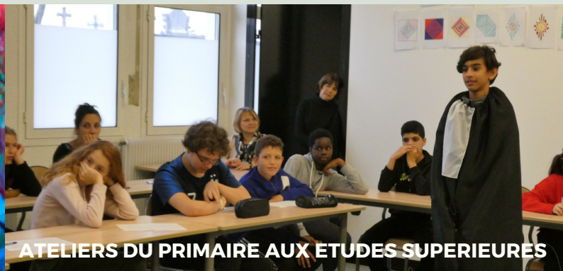
ATELIERS DU PRIMAIRE AUX ÉTUDES SUPÉRIEURES