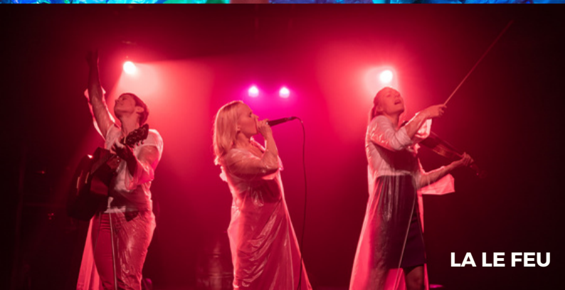
LA LE FEU