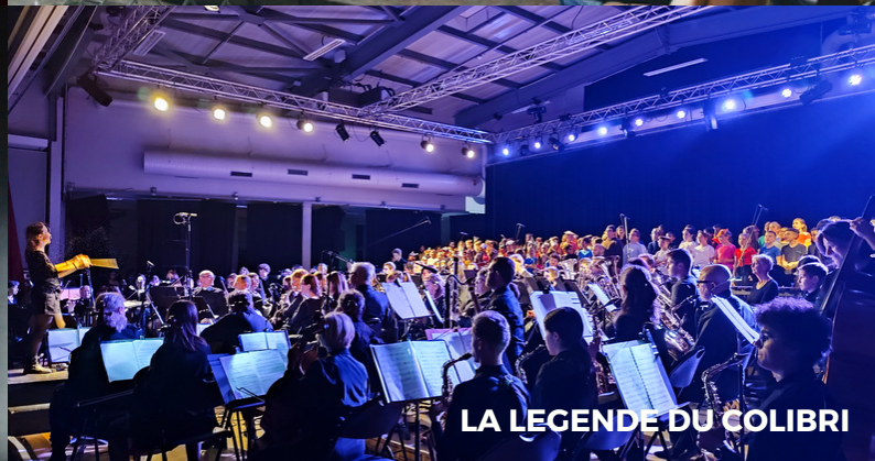
LA LÉGENDE DU COLIBRI