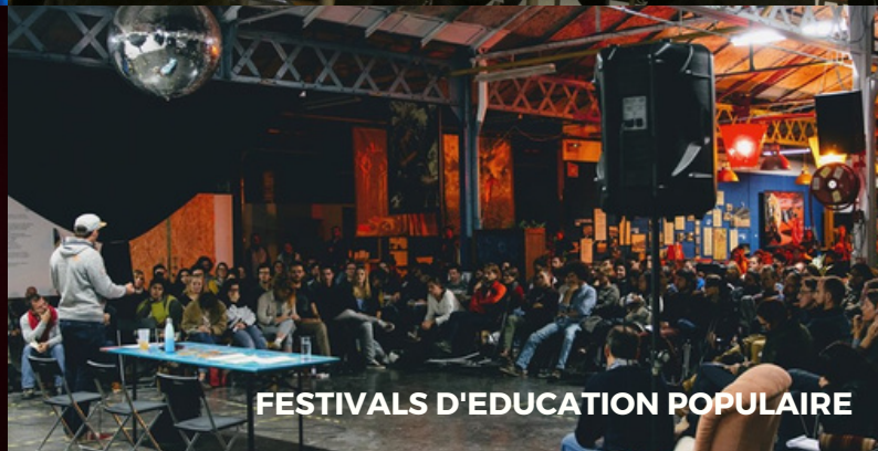
FESTIVALS D'ÉDUCATION POPULAIRE